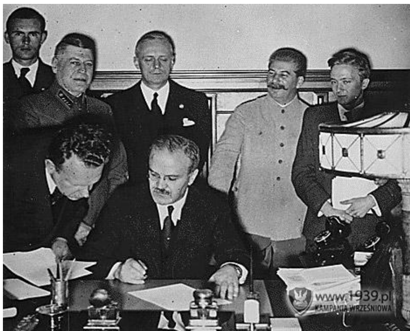
Rys. 1. Podpisanie paktu o nieagresji oraz tajnego protokołu przez Ribbentropa oraz Mołotowa w dniu 23 sierpnia 1939 roku (www.1939.pl).

Obecność Stalina na spotkaniu była prawdopodobnie elementem dokładnie przemyślanej strategii, ponieważ zazwyczaj unikał kontaktów z zagranicznymi gośćmi. Atmosfera na spotkaniu była raczej uprzejma a nawet przyjacielska. Wynikała ona, przynajmniej ze strony radzieckiej z przekonania, iż to sowietci „trzymają w garści” wszystkie atuty. Po wymianie uprzejmości, czwórka głównych rozmówców (Stalin, Mołotow, Ribbentrop i Schulenburg) przeszła do rzeczy. Ribbentrop pozwolił sobie na ironiczną propozycję zawarcia paktu o nieagresji na okres stu lat. Taka propozycja została dość chłodno odrzucona, umowa miała objąć okres zaledwie 10 lat. Następnie strona sowiecka przeszła do negocjacji, Stalinowi zależało na wykorzystaniu pośpiechu Hitlera i wynegocjowaniu jak największych ziem, co w efekcie udało się nienajgorzej. Gdy załatwiona została kwestia „strefy wpływów” zaczęto dyskutować na temat aktualnych wydarzeń politycznych na świecie oraz konsekwencjach zawarcia porozumienia niemiecko-sowieckiego. Spotkaniu nadano ściśle tajny charakter, a po ciężkiej pracy przyjezdnych podjęto przyjęciem 13 .