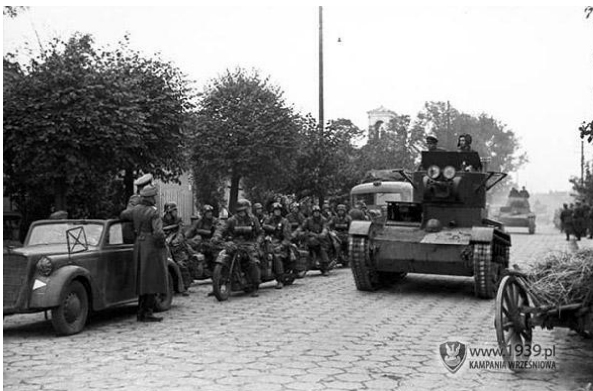
Rys. 2. Defilada wojsk sowieckich i niemieckich w Brześciu w dniu 22 września 1939 r.

Polacy byli nieświadomi tego co ma nastąpić. Tą informację może potwierdzić fakt, iż w dniu pojawienia się w Brześciu wojsk radzieckich, część osób uroczystie powitała żołnierzy Armii Czerwonej. Byli uważani wręcz za obrońców przed nasilającym się nacjonalizmem. Tylko starsi wiedzieli, że Rosja jest odwiecznym wrogiem, dlatego odnosili się do tej sytuacji z dystansem 15 .